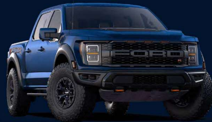
Azul Marino Metálico