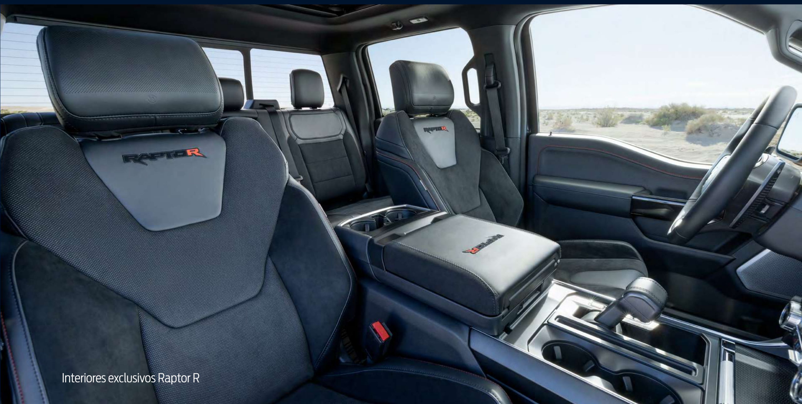
Interiores exclusivos Raptor R