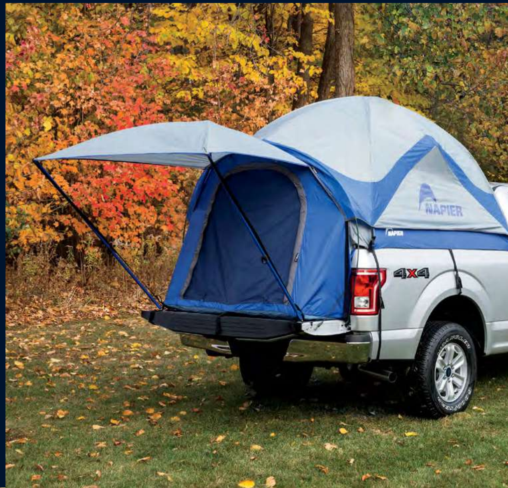
CASA DE CAMPAÑA PARA CAJA 5.5'