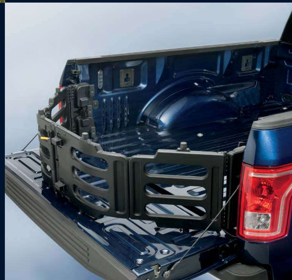
DIVISOR DE CAJA