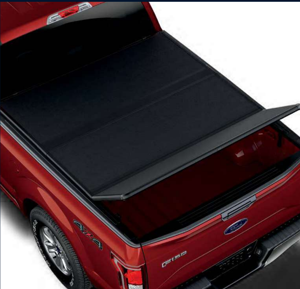
CUBIERTA RÍGIDA PLEGABLE DE CAJA 5.5'